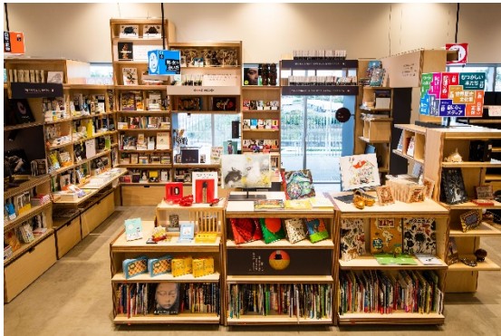
EDIT TOWN QUBE