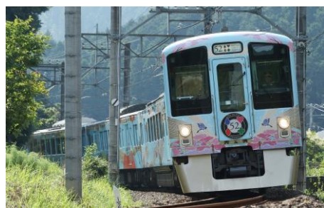
西武 旅するレストラン「52席の至福」

※新型コロナウイルス感染症の感染拡大予防の観点から、大型バス55名定員を最大26名さまにて運行します。