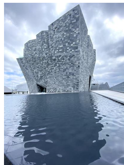
角川武蔵野ミュージアム外観