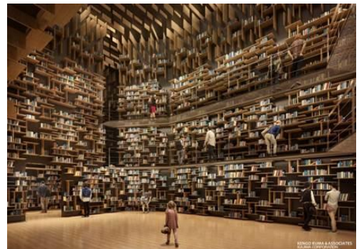
本棚劇場 パース図

ミュージアムの象徴となるのは高さ約8mの巨大本棚にかこまれた空間「本棚劇場」。KADOKAWA刊行物と角川源義文庫、山本健吉文庫、竹内理三文庫、外間守善文庫ほかの個人蔵書が一堂にならびます。また、本棚劇場では定期的に「本と遊び、本と交わる」をコンセプトとしたプロジェクションマッピングを上映しています。