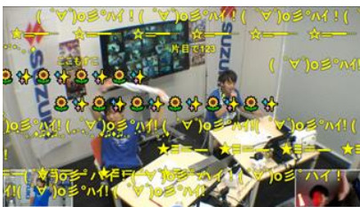
ニコニコネット町会議 2020 Supported by SUZUKI