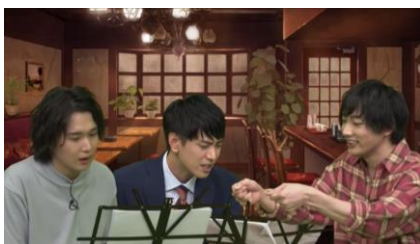
黒羽麻璃央 オンライン朗読劇「たもつん」