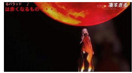
ニコニコネット超会議 2020 夏×EGOIST LIVE on www. 2020 side-A2 【chrysalization code 404 : ebenfalls】