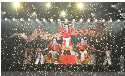
超歌舞伎 Supported by NTT 「夏祭版 今昔饗宴千本桜」