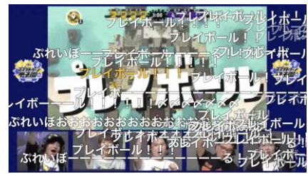
第5回スプラトゥーン甲子園 全国決勝大会