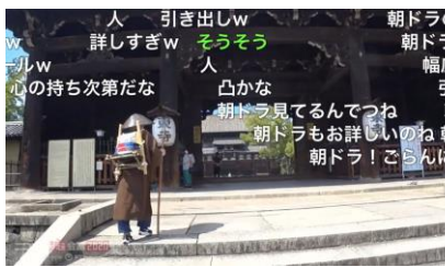
仁和寺の法師 たいたい150キロ徒歩巡礼生放送 【御室成就丸】88ヶ所整備事業ネット動画計画】