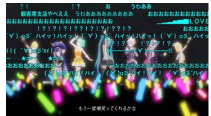
VOCALOID Fes supported by 東武トッパーズ