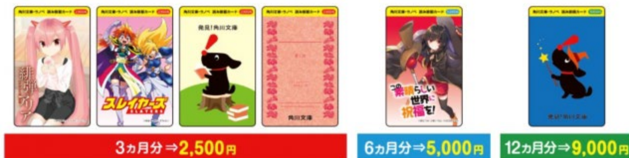
角川文庫・ラノベ 読み放題カード

※販売店、使用方法は「すごいな角川文庫」サイト ( https://bunko-cp2020.kadobun.jp/ ) よりご確認ください。