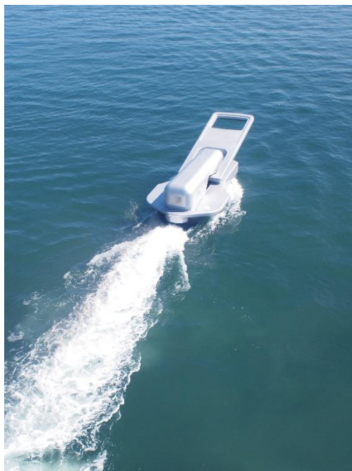
瀬戸内国際芸術祭 2010 に出展