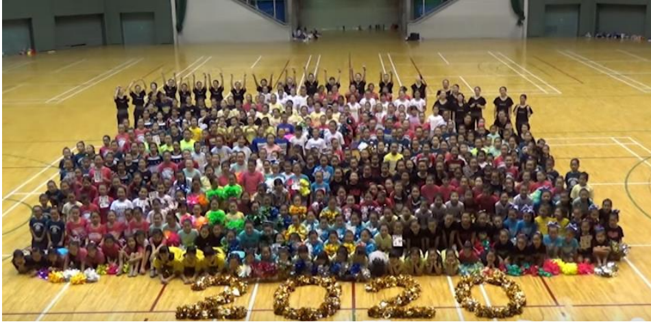
(写真キャプション：日本チアダンス協会受賞作品「CHEER DANCEで2020をCHEER UP！」)