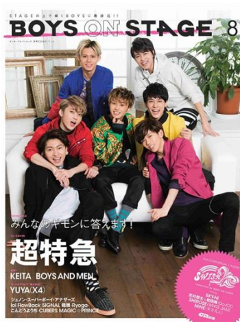
ダンス&ボーカルボーイズグループ専門誌 BOYS ON STAGE