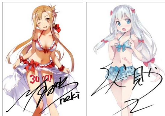
↑ 著者直筆サイン入り複製原画 イメージ画像

●電撃文庫3000タイトル突破!!大感謝フェア 公式サイト: http://dengekibunko.jp/3000/