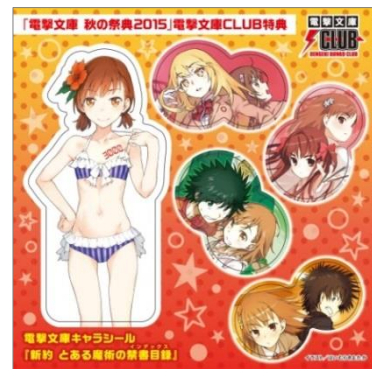
↑ 電撃文庫キャラシール イメージ画像

●電撃文庫 秋の祭典2015 公式サイト: http://db2015fes.dengeki.com/