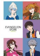
プレゼント② 「EVANGELION クリアファイル」