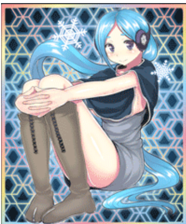
■雪女【コンプエース Ver】イラスト：むこうじまてんろ