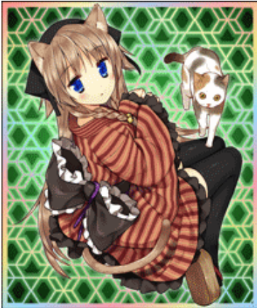
■妖猫（ようびょう）イラスト：華々つぼみ

また、ニュータイプエースでは尾崎祐介氏、コンプエースではむこうじまてんろ氏と連載担当作家がそれぞれ妖怪イラストを描き下ろしました。また、コンプティークでは同誌で『放課後アトリエいろ』を連載する漫画家・華々つぼみ氏が描き下ろしイラストを担当。各誌で用意されたキュートな妖怪たちをぜひ手に入れてください。