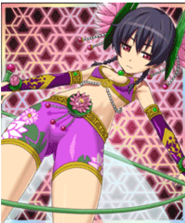
■花魄（かはく）イラスト：尾崎祐介