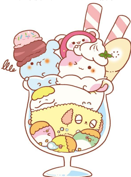
↑ 『スイーツキャラモード』 キャラクターイメージ

KADOKAWA、タカラトミーアーツ、サン宝石の3社による強力コラボレーションから生まれた新キャラクター『スイーツキャラモード』に、ぜひご注目ください。