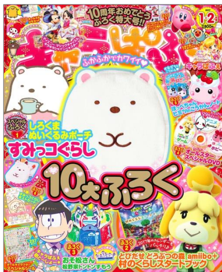
↑「キャラぱふえ」最新号表紙