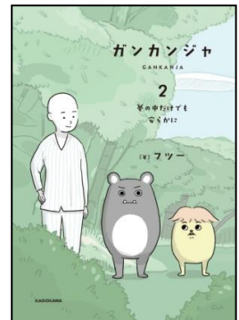
『ガンカンジャ 2』→ 表紙(帯なし)