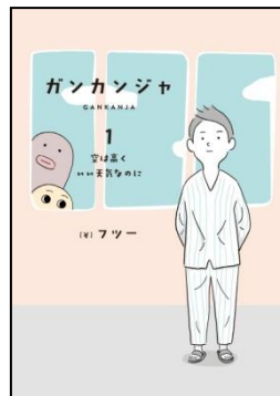
←『ガンカンジャ 1』 表紙(帯なし)