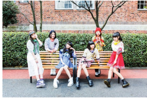
Little Glee Monster