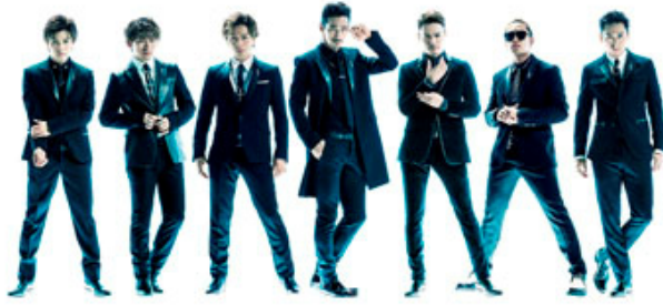
三代目 J Soul Brothers