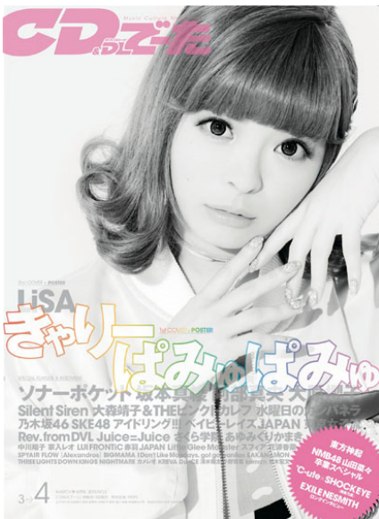
『CD&DLで一た』4月号カバー

創刊28年目となる、“音楽がもっと好きになる”音楽情報誌(奇数月14日発売)。J-POPを中心としたアーティストのロングインタビューやコラムなど、様々なコンテンツを取り扱っています。