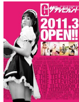
「Gザテレビジョン プラス」