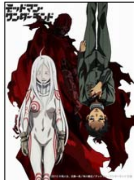
「デッドマン・ワンダーランド ANIMATION OFFICIAL SITE」