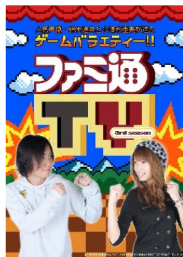
「ファミ通TV 3rd SEASON」